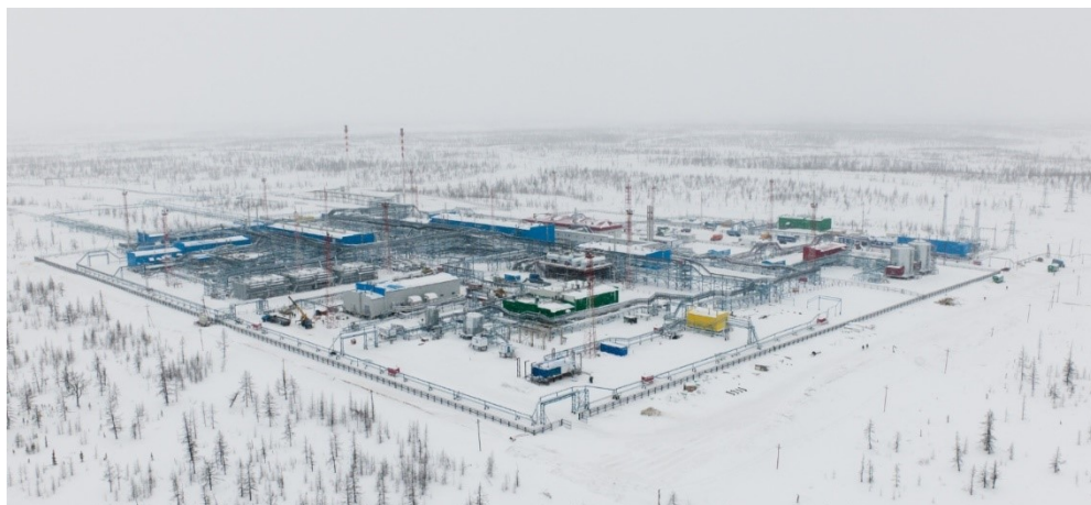
Фото: Заполярное месторождение (сайт ПАО «Газпром»).

Материал газеты «Профсоюзный вестник» №7, 03.12.2018. Николай Рыбалка.